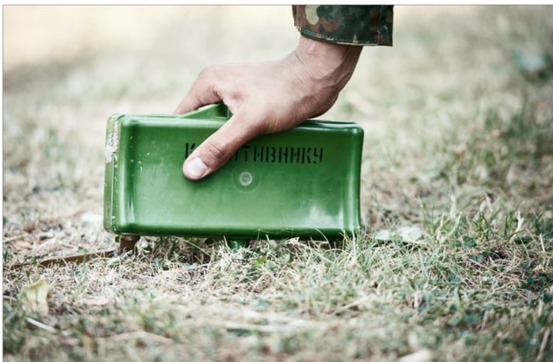
Мина в боевом положении