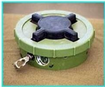
Рис.1 Общий вид мины ПМН-2

ПМН-2 Противопехотная мина нажимного типа